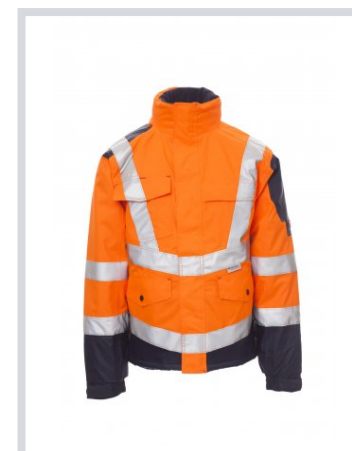
ARANCIONE FLUO/BLU NAVY