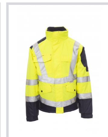
GIALLO FLUO/BLU NAVY